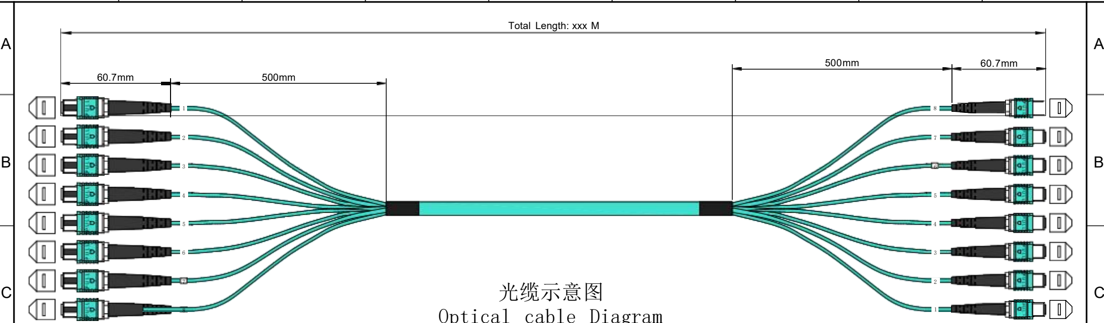
光缆示意图 Optical cable Diagram